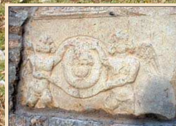
GLAVA MEDUZE , arheološki nalaz iz Burnuma nalazi se u manastiru Krka

no, danas već poprma obrise arhitektonске konstrukcije: riječ je o kružnoj plohi arene i ljevkastom obrubu gledališta za 8000 ljudi. Vide se i linije četiriju amfiteatarskih vrata - kao na kakvom golemom kompasu - na jugu, sjeveru, istoku i zapadu. Amfiteatar je smješten između Knina i Skradina, 150 metara sjeverozapadno od ceste kojom svakodnevno prolaze automobili. Neupućeni vozači ili slučajni namjernici ipak ga ne mogu uočiti. Načinjena od kamenih gromada koje su stoljećima pucale od zime i žege, antička građevina mimikrijski se pritajila u dalmatinskom pejzažu, slična golemoj vrti. Da bi se stiglo do amfiteatara, potrebno je razgrtati drač i skakati preko suhozida koji označava međe zapuštenih sitnih seljačkih oranica.