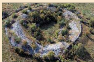
AMFITEATAR kod Ivoševaca snimljen iz zraka 2002.

Prije otkrića amfiteatar je bio potpuno zarastao u travu, grmlje i drveće i tek je iz zraka bilo moguće ustanoviti da nije riječ o običnoj vrti. Danas je raskrčen i na njemu su počela prva iskopavanja i to kod južnog ulaza.